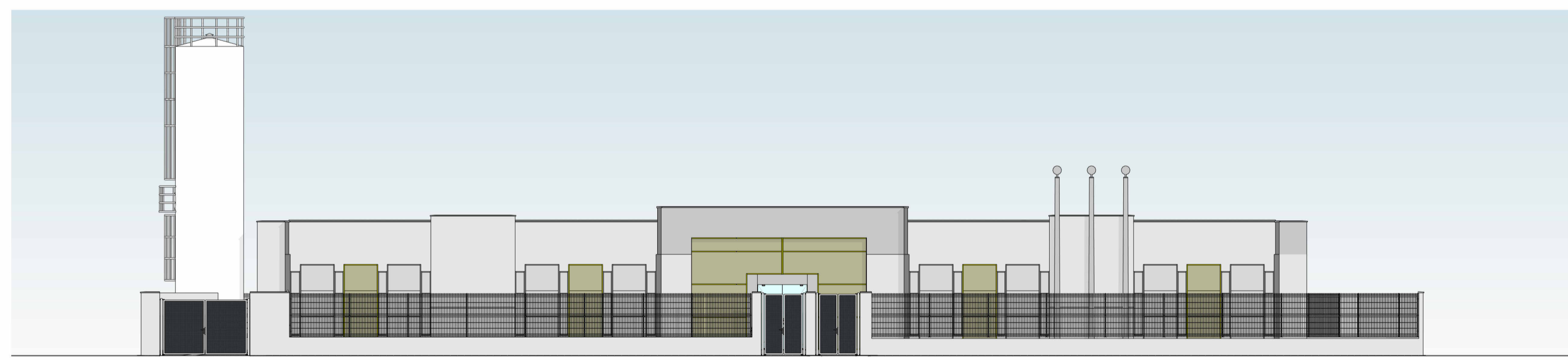
FACHADA FRONTAL ESC: 1 : 125