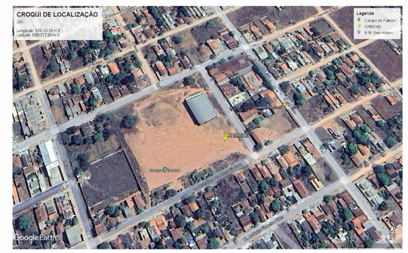
CROQUI DE LOCALIZAÇÃO ESC: 1 : 500