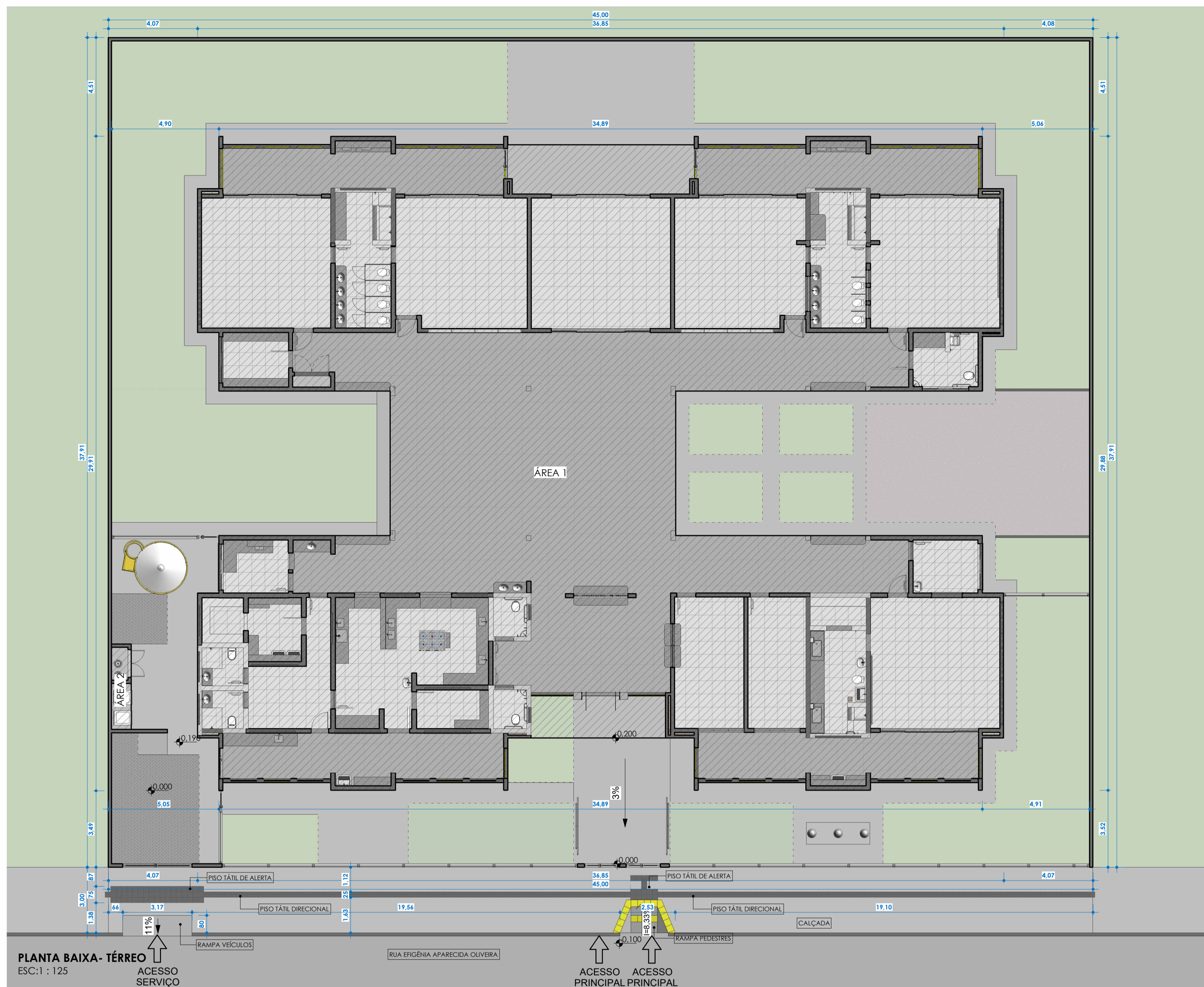
PLANTA BAIXA - TÉRREO ESC: 1 : 125