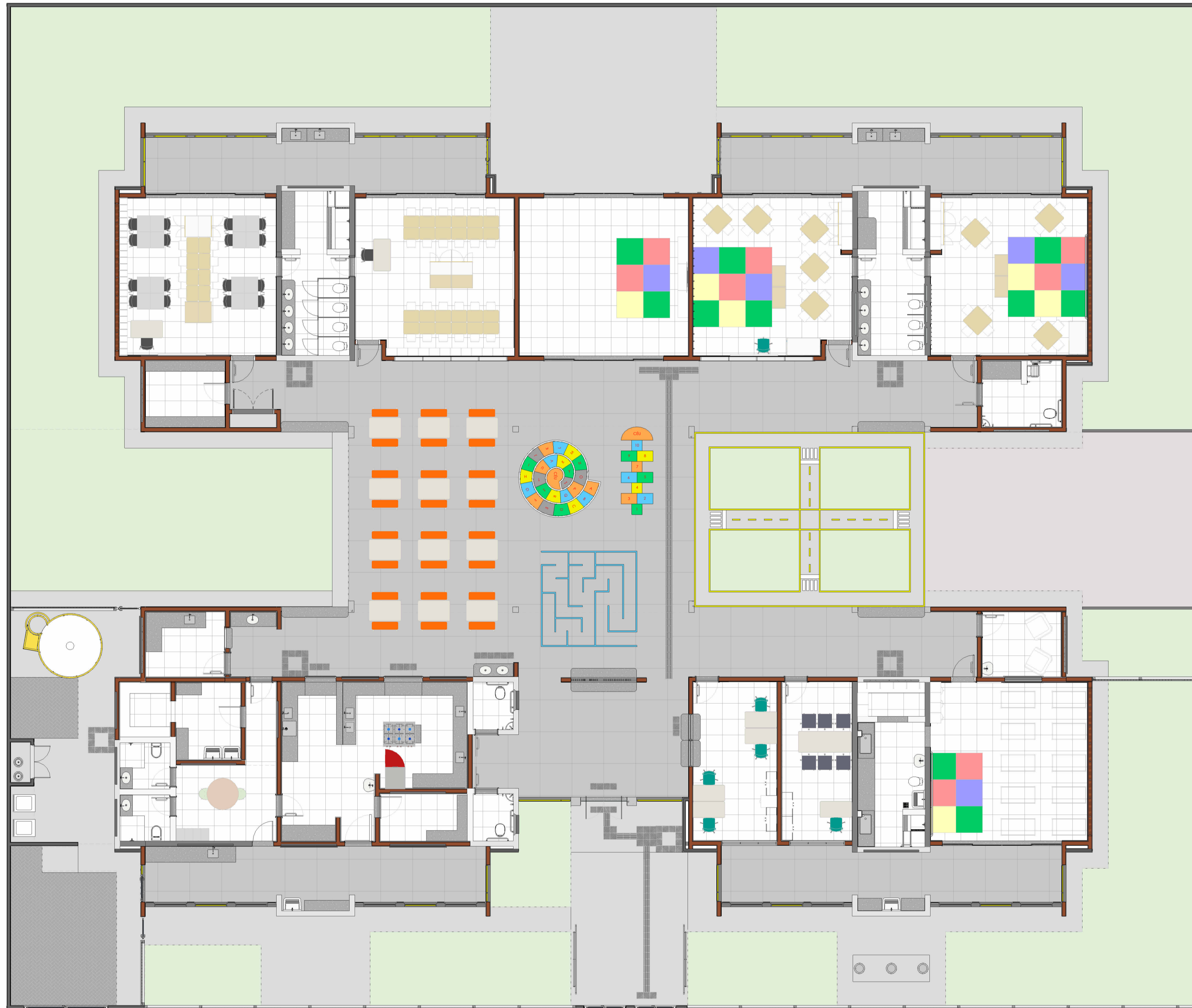
PLANTA LAYOUT - TÉRREO ESC: 1 : 100