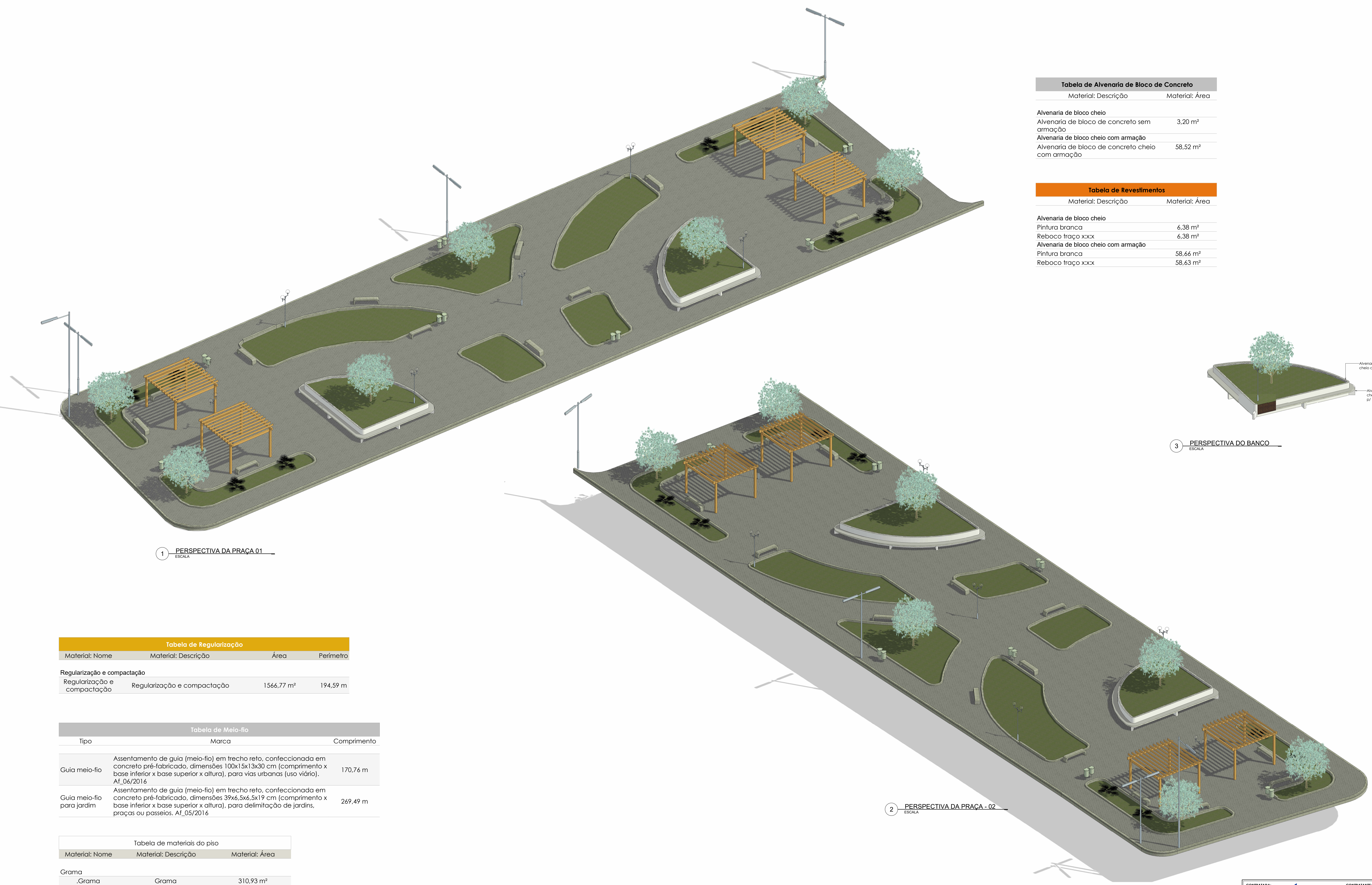
Tabela de Alvenaria de Bloco de Concreto