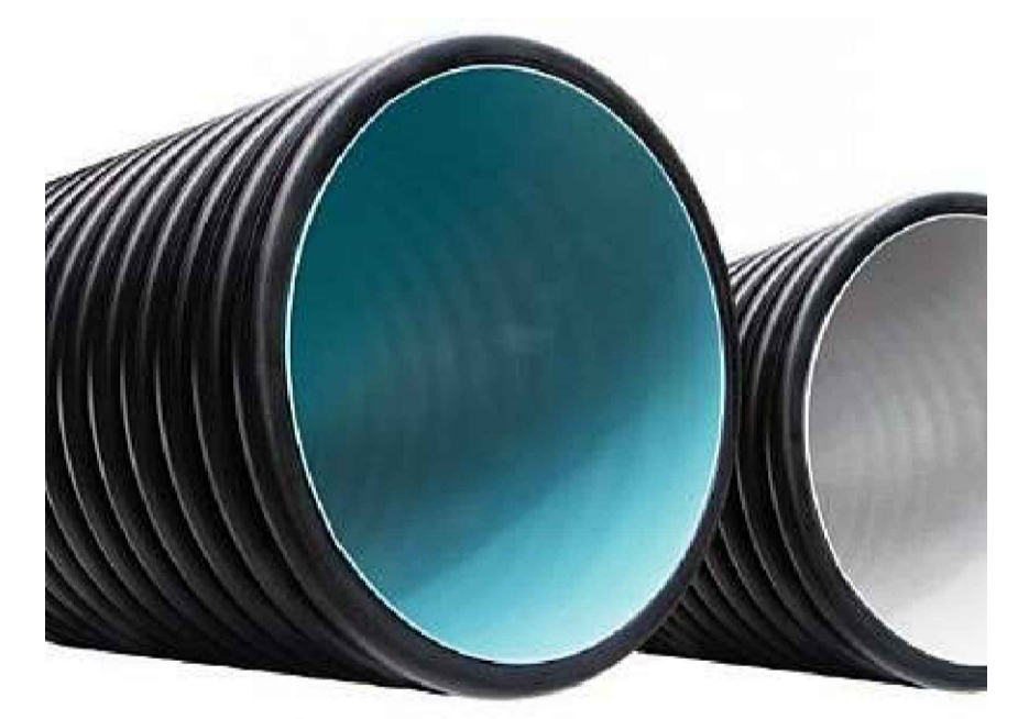
03 DETALHE TUBO PEAD ESCALA 1:50