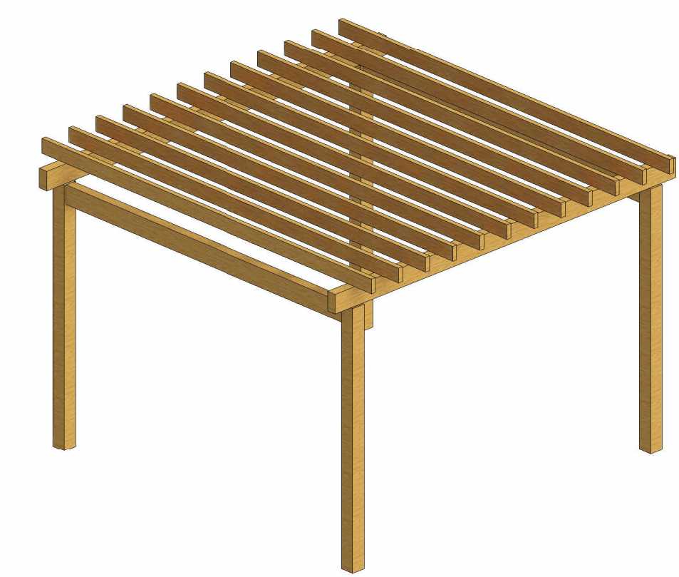
4 VISTA PERSPECTIVA - PERGOLADO ESCALA