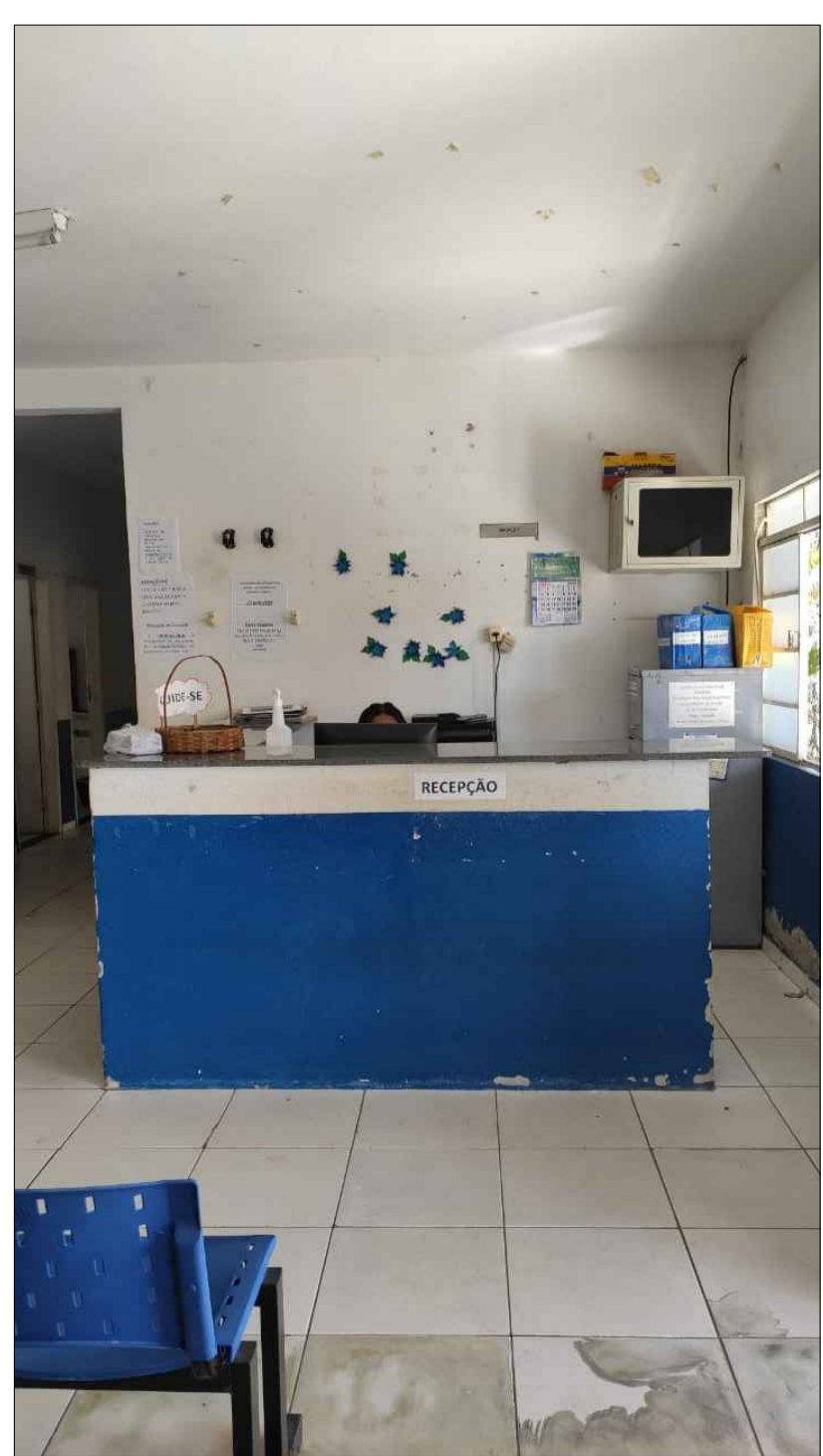
RECEPÇÃO DE REGISTROS