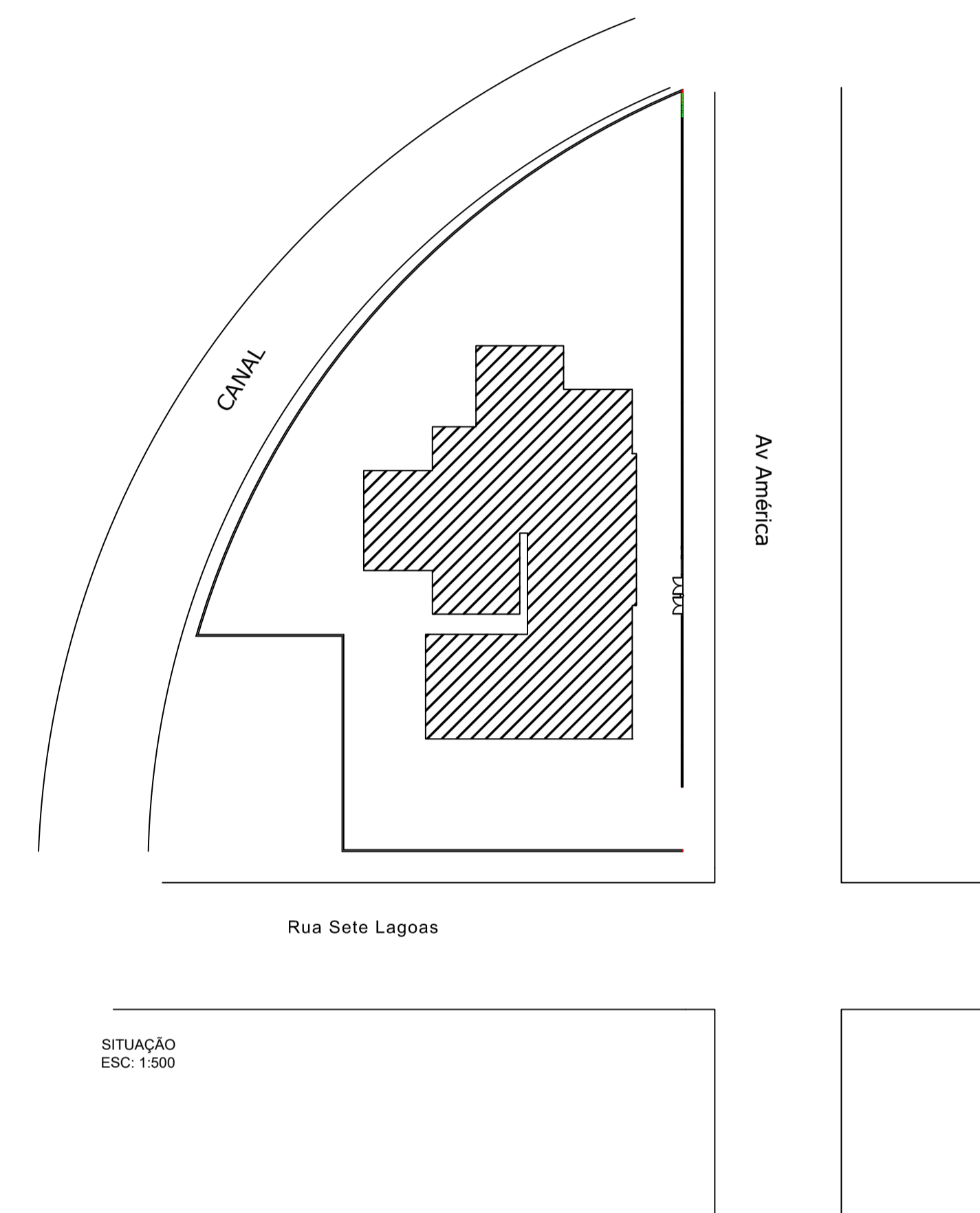
SITUAÇÃO ESC: 1:500