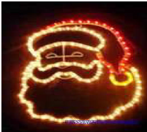
FIGURA DE NATAL ILUMINADA - ROSTO PAPAI NOEL GIGANTE

Site: www.pirapora.mg.gov.br - Email: licitacao@pirapora.mg.gov.br