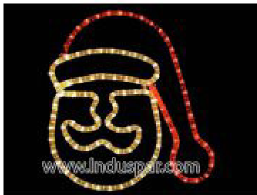
FIGURA ILUMINADA NATAL - FACH-02/A ORNATO FACHADA - MED 30x30 cm